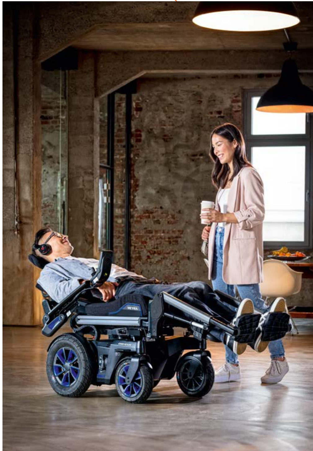
Auch wenn es im Büro mal später wird – der iCHAIR MEYLIFE ist für den ganztägigen Einsatz gebaut und sorgt mit elektrischen Verstellmöglichkeiten zwischendurch für Entspannung und den nötigen Komfort.