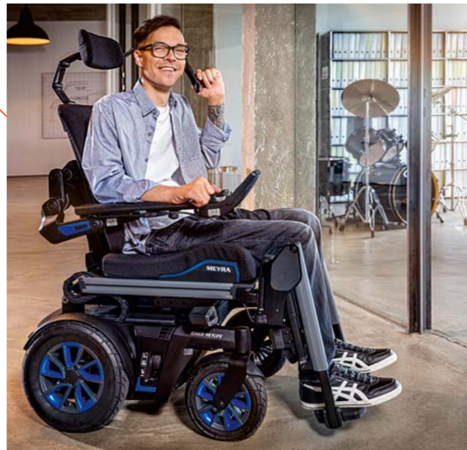
Mit Allradfederung und elektrischer Lenkdarretierung (noch in Entwicklung).