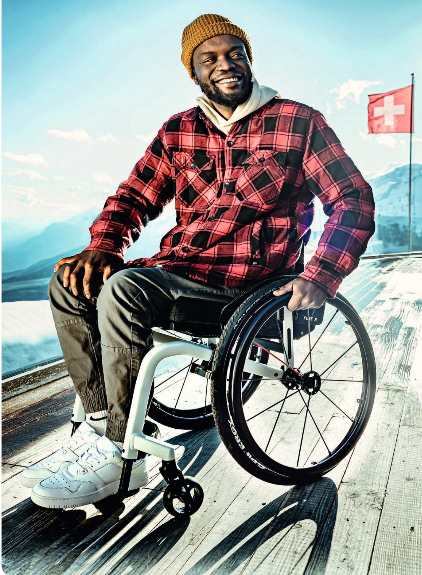
ABB.: FUSE R