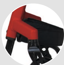
Versteckte Justierungs- möglichkeiten